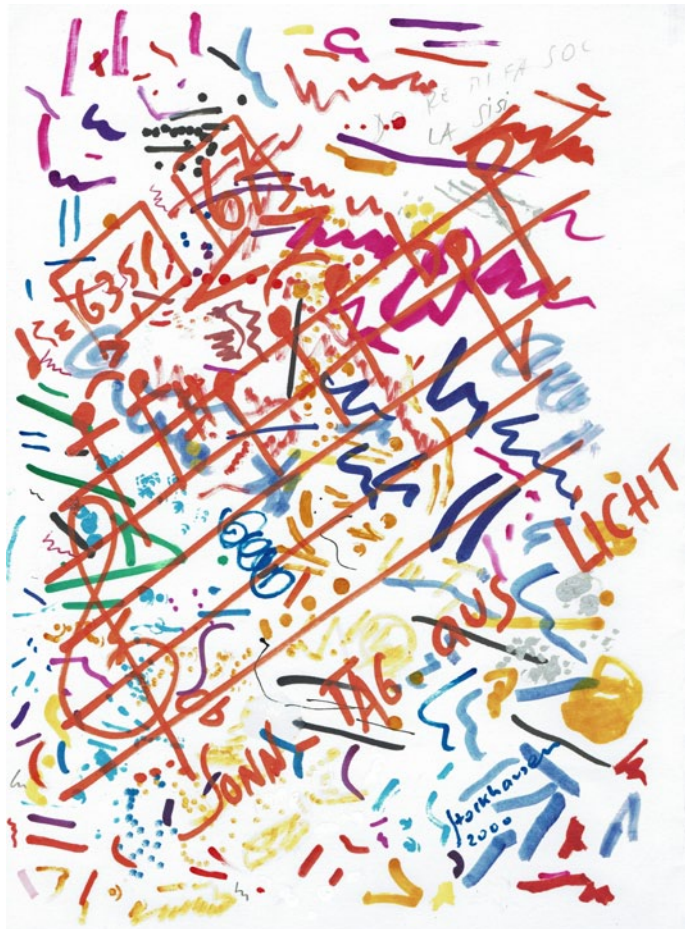
1 Titel: Karlheinz Stockhausen, INVASION (Detail), 1990 Filzstift auf Papier, 44,7 × 62,4 cm